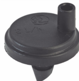
Agri Drip Auto-compensável Barb