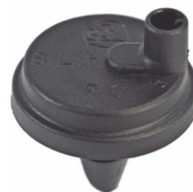
Agri Drip Standard Barb