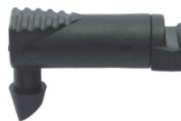
Midi Drip - Barb