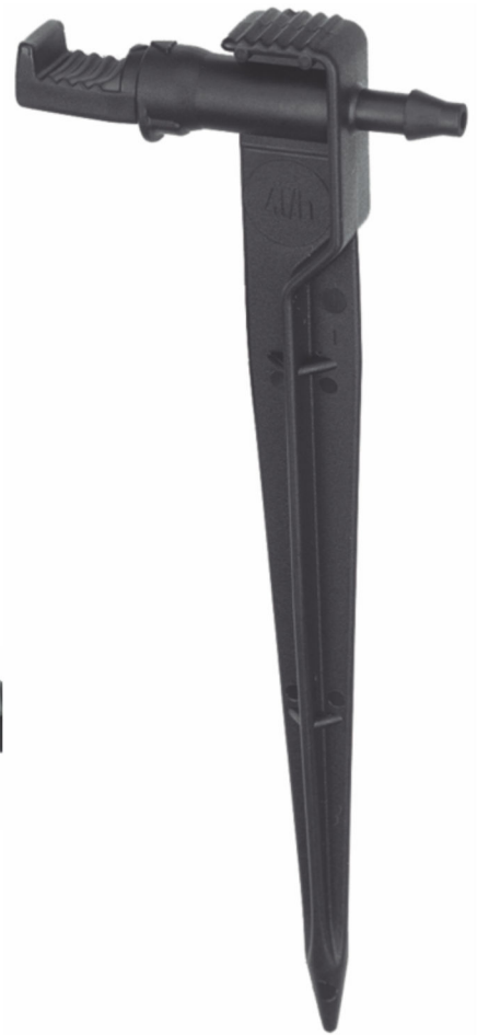
Midi Drip - Spike