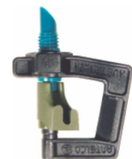
Rotor Spray™ Invertido